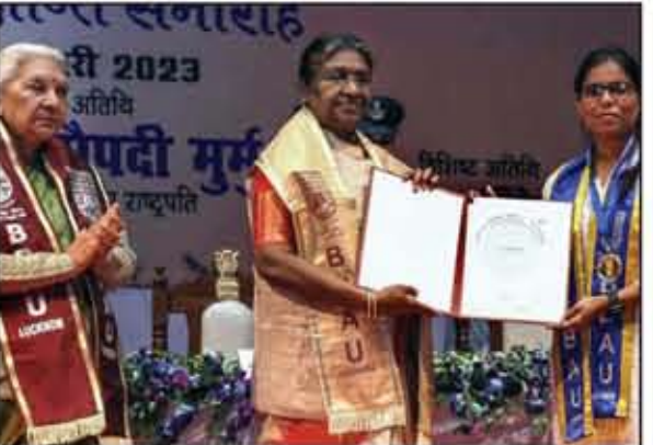
ઉત્તર પ્રદેશના પાટનગર લખનોમાં બાબા સાહેબ ભીમરાવ આંબેડકર યુનિવર્સિટીના યોજાયેલા ૧૦માં દિશાત સમારોહમાં મુખ્ય અતિથિ તરીકે ઉપસ્થિત રાષ્ટ્રપતિ ત્રીપ્તી મુમુ વિદ્યાર્થીઓને પદવી એનાયત કરી રહ્યા છે, સાથે ઉત્તર પ્રદેશના રાજ્યપાલ આનંદીબેન પટેલ ઉપસ્થિત નજરે પડે છે.